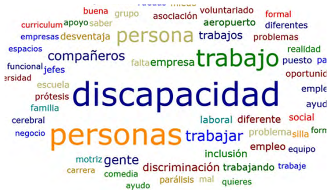
Figura 1. Nube de palabras producto de la transcripción de las 11 entrevistas realizadas.

se menciona como la discriminación es ejercida por compañeros, familia, jefe, etc., y que es, evidentemente, una desventaja y causa de problemas, la discriminación está asociada a la discapacidad en sus diferentes formas, y es importante en el contexto del trabajo y la necesidad de adecuaciones. Podemos observar conceptos que repercuten de manera positiva en los participantes como adecuación, ayuda y apoyo.