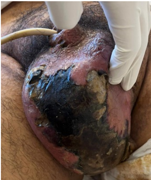
Vista inferior del escroto en donde se ven las zonas de tejido desvitalizado y la presencia de larvas en cercanía a los pliegues, en la vista lateral.