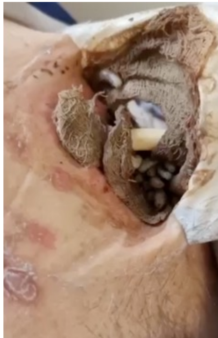
Se observa presencia de múltiples larvas en el sitio de la cistostomía.