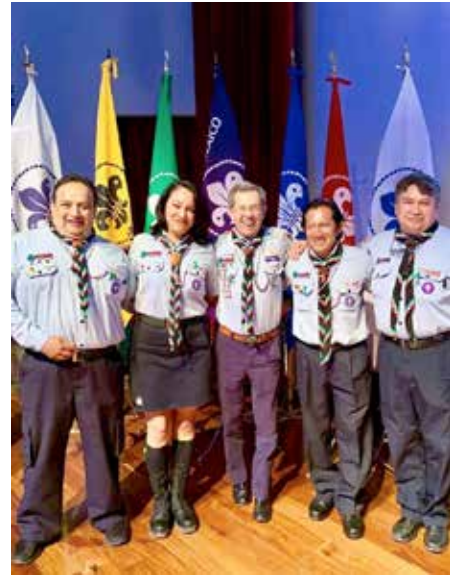
Figura 4: Presidente de la Asociación Scout de México.

cuatro categorías según su nivel de madurez: niños de 7 a 11 años, adolescentes de 11 a 15 años, jóvenes de 15 a 18 años y adultos jóvenes de 18 a 22 años.