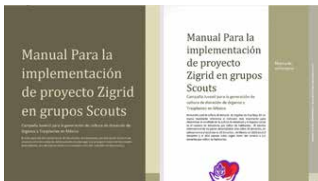
Figura 1: Ejemplos de material educativo.

las barreras tanto conscientes como inconscientes, así como también la desinformación. Dicho mensaje debe estar dirigido a todos los niveles de la sociedad, en particular a los jóvenes.