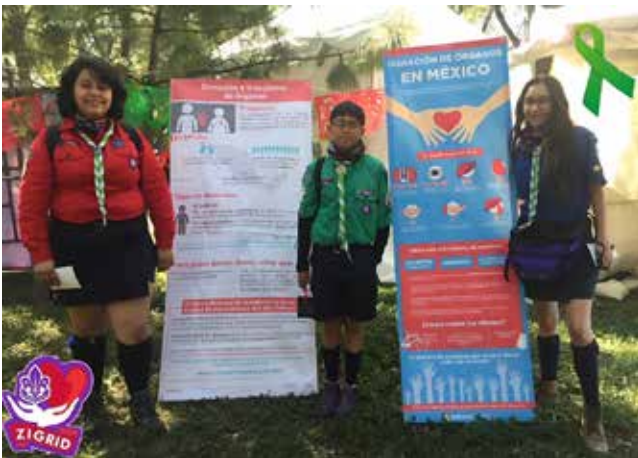
Figura 3: Scouts en Durango.

Inspirados por el acto de donación de órganos protagonizado por una joven scout de 16 años, que encarna la empatía dentro de los valores del movimiento scout , y respaldados por el material educativo proporcionado por el Instituto Nacional Central Único Coordinador de Ablación e Implante de Argentina (INCUCAI), se ha constituido un equipo de educadores. Este equipo, bajo la tutela de especialistas en trasplantes y con la colaboración de entidades como el Centro Nacional de Trasplantes (CENATRA), Consejos Estatales de Trasplante (COETRAS) y la Sociedad Mexicana de Trasplantes (SMT), ha desarrollado una serie de materiales educativos, incluyendo fichas lúdicas, para llevar a cabo actividades educativas dirigidas a diferentes grupos de jóvenes. Estos grupos se dividen en