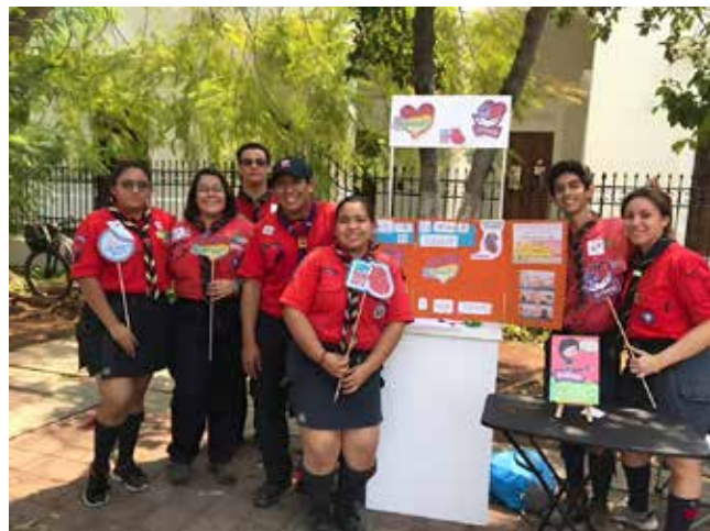
Figura 5: Scouts en Baja California.

Además de lo antes mencionado, se establecieron convenios y vinculaciones con diversas instancias a nivel federal y estatal. Esto incluyó un convenio con el CENATRA, 13 convenios con los CETRAS de los estados implicados, 25 vinculaciones con universidades e instituciones educativas locales y organizaciones no gubernamentales. También se formalizó un convenio con el Hospital Militar de México. En forma paralela, las campañas digitales lideradas por los jóvenes