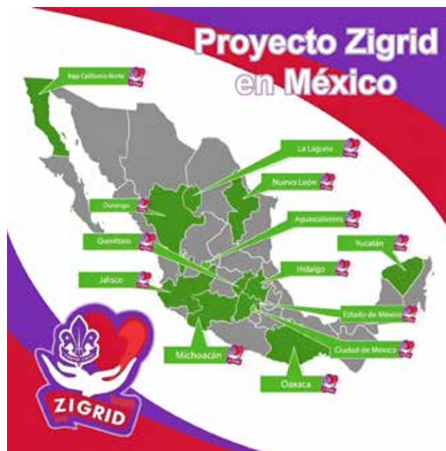
Figura 2: Mapa Zigrid.

La educación emerge como el sendero principal para fomentar una cultura que aborde la escasez de órganos, por ende, es crucial priorizar la lucha contra