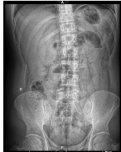
Figura 2. Radiografía anteroposterior de abdomen en donde se observa la presencia de aire libre subdiafragmático

A su ingreso a urgencias con signos vitales dentro de parámetros normales. En la exploración física se encuentra palidez mucotegumentaria, mucosa oral deshidratada, abdomen con dolor intenso en epigastrio y mesogastrio, peristalsis aumentada, se ingresa con diagnóstico de probable gastritis aguda o pancreatitis, manejo inicial con ayuno, omeprazol, metoclopramida, clonixinato de lisina, paracetamol y ketorolaco, se realizan paraclínicos que incluyeron biometría hemática (BH), química sanguínea (QS), pruebas de funcionamiento hepático (PFH), amilasa, lipasa, examen general de orina (EGO), radiografía abdominal de pie y decúbito, tele de tórax y prueba rápida de Coronavirus de tipo 2 causante del síndrome respiratorio agudo severo (SARS-Cov-2). En los laboratorios se encontró leucocitosis y neutrofilia, enzimas pancreáticas normales. En la radiografía se observa aire libre subdiafragmático (Figura 2). Se solicita tomografía axial computarizada (TAC) abdominal donde se observa neumoperitoneo, plastrón en fosa ilíaca derecha, asa fija y dilatada (Figura 3A), así como líquido libre en hueco pélvico de aproximadamente 350 ml (Figura 3B).