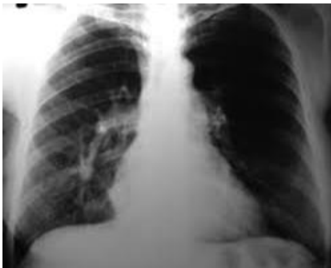
Figura 1. Signo radiográfico de la cimitarra, Patel et al 2020.

En este caso, describimos el curso clínico de un neonato con síndrome de cimitarra, así como el abordaje diagnóstico necesario.