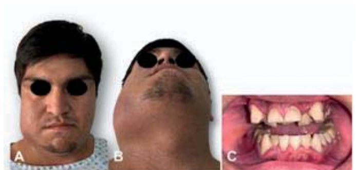
Figura 1. Fotos iniciales. A) Vista frontal, se observa aumento de volumen en hemicara derecha. B) Vista anteroinferior, cuello asimétrico, sin desplazamiento de la tráquea. C) Vista intraoral, apertura limitada, con presencia placa bacteriana.

fueron aliviadas automedicándose con analgésicos y antiinflamatorios, retrasando así la búsqueda de atención médica. A la exploración física dirigida de cabeza y cuello, a nivel facial en tercio medio e inferior, se observó aumento de volumen en región de ángulo mandibular derecho, a la palpación de consistencia indurada, con cambios hiperémicos e hipertérmicos. En la exploración intraoral presentó apertura limitada de 3 mm aproximadamente, higiene oral deficiente, múltiples caries dentales, alteración en la oclusión dental y secreción purulenta de la zona afectada (Figura 1). En las radiografías postero-anterior y lateral de cráneo se observó línea radiolúcida en la región del ángulo mandibular derecho; en la tomografía computarizada del macizo facial se observó solución de continuidad en la misma región, con presencia de gas en el espacio bucal (Figura 2). En los estudios de laboratorio presentó una leucocitosis de 15,000 mm 3 , a expensas de neutrófilos 9,000 mm 3 .