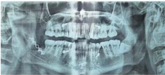
Figura 5. Ortopantomografía de control, se observa placa de titanio en adecuada posición.