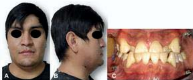
Figura 6. Fotografías finales. A) Vista frontal. B) Vista lateral, se observa herida en proceso de cicatrización. C) Vista intraoral, oclusión estable, con presencia de tornillos de FMM.