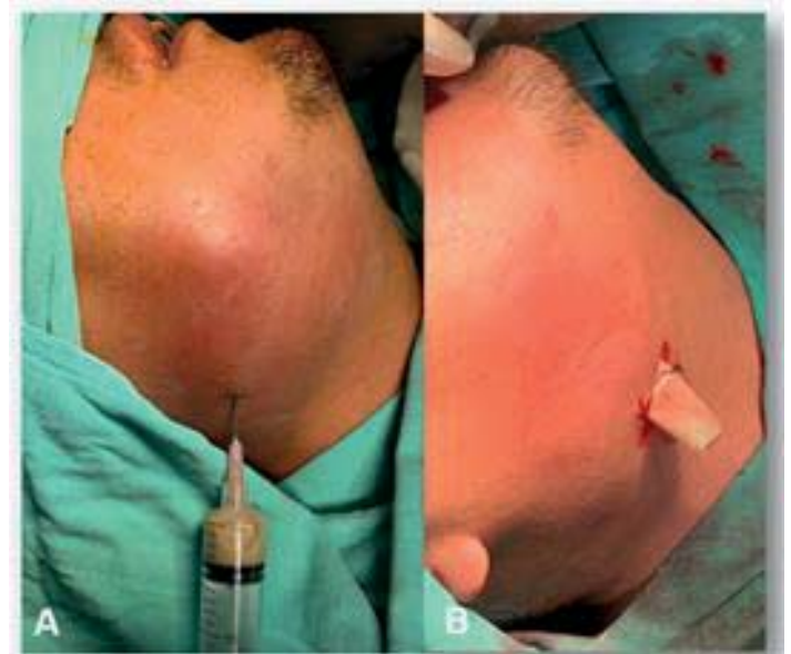
Figura 3. Fotografías transquirúrgicas. A) Toma de muestra de secreción purulenta de aspecto amarillento para cultivo bacteriano. B) Colocación de drenaje tipo Penrose.

Streptococcus constellatus , la cual en el antibiograma presentó sensibilidad a los antibióticos utilizados.