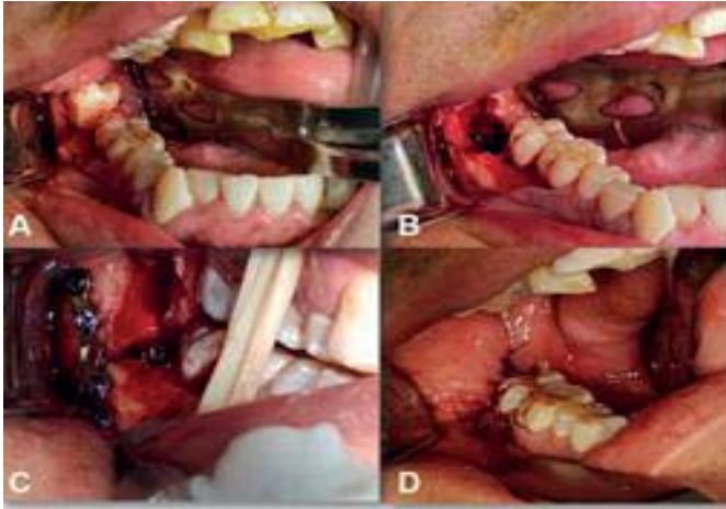
Figura 4. Fotos transquirúrgicas. A) Odontectomía del tercer molar en el trazo de fractura. B) Reducción de segmentos óseos. C) Fijación interna con material de osteosíntesis. D) Sinéresis de tejidos blandos.

adecuada posición (Figura 5). En el seguimiento presentó adecuada evolución, heridas cicatrizando, ausencia de signos inflamatorios y estabilidad oclusal (Figura 6). No se presentaron complicaciones.