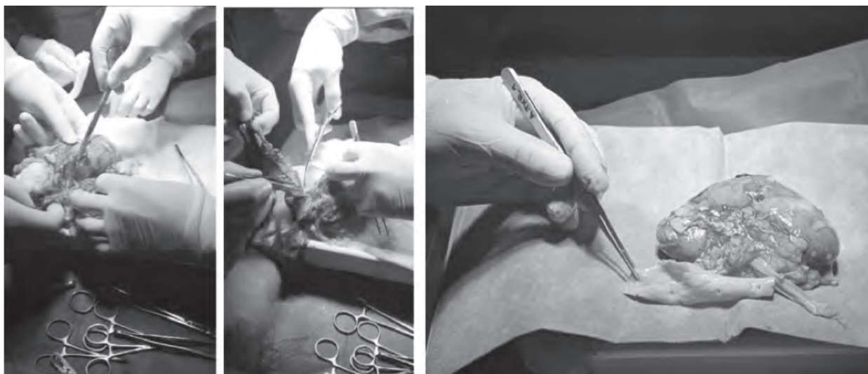
Figura 1: Preparación del riñón para la conexión

definen la elección del tipo de cánula que se utilizará. Se dispone de tres modelos de cánulas: Universal, SealRing y Straight, en diferentes medidas de cada una. En los casos en los que se dispuso de un parche aórtico de buena calidad, se utilizó SealRing ya que además permite conectar fácilmente múltiples arterias si están cercanas. Cuando el parche era incompleto, se optó por el modelo Universal y, en los casos sin parche se utilizó Straight, que conlleva una leve