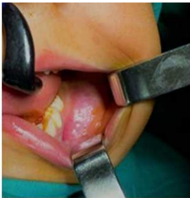
Fig. 1 - Aumento de volumen intraoral en región de 74 hasta 36.

Se realizó radiografía panorámica donde se encontraron dos lesiones radiolúcidas rodeadas de halo radiopaco, una en región de 36 y la otra en región de 46. Ambas lesiones estaban en íntima relación con 36 y 46 no erupcionados. Se observó la expansión de corticales, principalmente de la vestibular (Fig. 2).