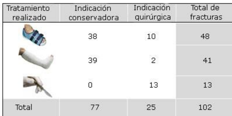
Fig. Tratamiento vs indicación terapéutica de las fracturas del primer metatarsiano.

En cuanto a las actividades profesionales de los lesionados, 6 pacientes desempeñaban trabajos de tipo sedentario (A), 39 precisaban deambulación prolongada sobre terreno llano (B) y 55 estaban sometidos a altos requerimientos sobre terreno irregular (C). No se pudo conocer la actividad laboral de 2 casos, al no quedar ésta reflejada en sus historiales. Con respecto a la edad, se distribuyó la muestra en cuatro categorías con puntos de corte en las decenas, es decir, sujetos de hasta 30 años, de 31 a 40 años, entre 41 y 50 años, y mayores de 51 años. Así, 41 pacientes se encontraban en el rango de edad [16-30], 29 sujetos en el rango de edad [31-40], 21 individuos entre [41-50], y otros 11 lesionados entre [50-65] años.