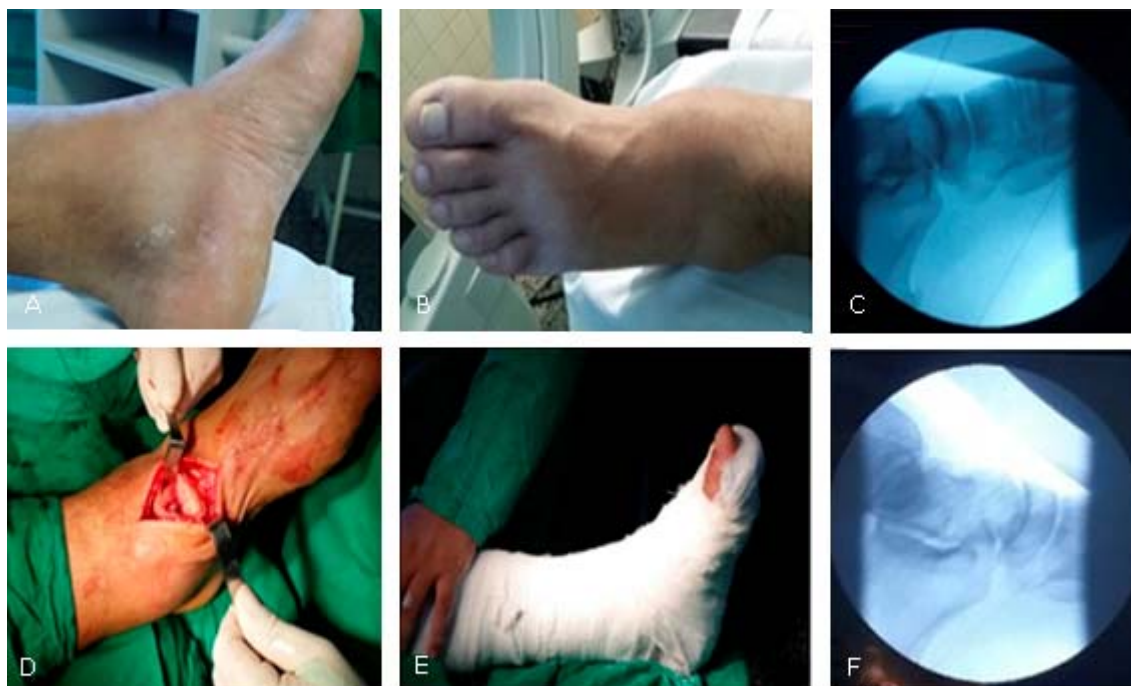
Fig. 5. Luxación astragaloescafoidea en paciente de 32 años de edad. A y B) Aumento de volumen y deformidad en la zona del mediopié. C) Proyección en el intensificador de imágenes de la luxación astragaloescafoidea; nótese la desaparición del espacio articular. D) Abordaje universal anterior del pie. E) Inmovilización con férula tipo bota del pie izquierdo. F) Control radiográfico en intensificador de imágenes donde se observa la reaparición del espacio articular