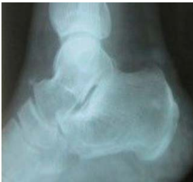
Fig. 4. Estudio radiográfico en vista lateral selectiva de mediopié izquierdo a las 12 semanas del trauma.