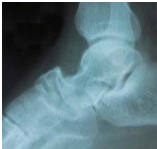
Fig. 2. Estudio radiográfico preoperatorio en vista lateral selectiva de mediopié izquierdo.

Paciente masculino de 19 años de edad, mestizo, con antecedentes de salud aparente, que fue traído al Cuerpo de Guardia de Ortopedia y Traumatología del Hospital Militar Central "Dr. Luis Díaz Soto". Refería haberse caído de una altura aproximada de 3 m. Cayó con el pie izquierdo en máxima flexión plantar y presentó dolor e impotencia funcional en dicho pie. Al examen físico se pudo observar marcha antálgica, aumento de volumen, equimosis y deformidad en el dorso del pie, así como dolor a la palpación a ese nivel. En el estudio radiográfico del pie izquierdo se apreció pérdida de las relaciones anatómicas de la articulación calcaneocuboidea con desplazamiento lateral y solución de continuidad ósea en el escafoides tarsiano (Fig. 2).