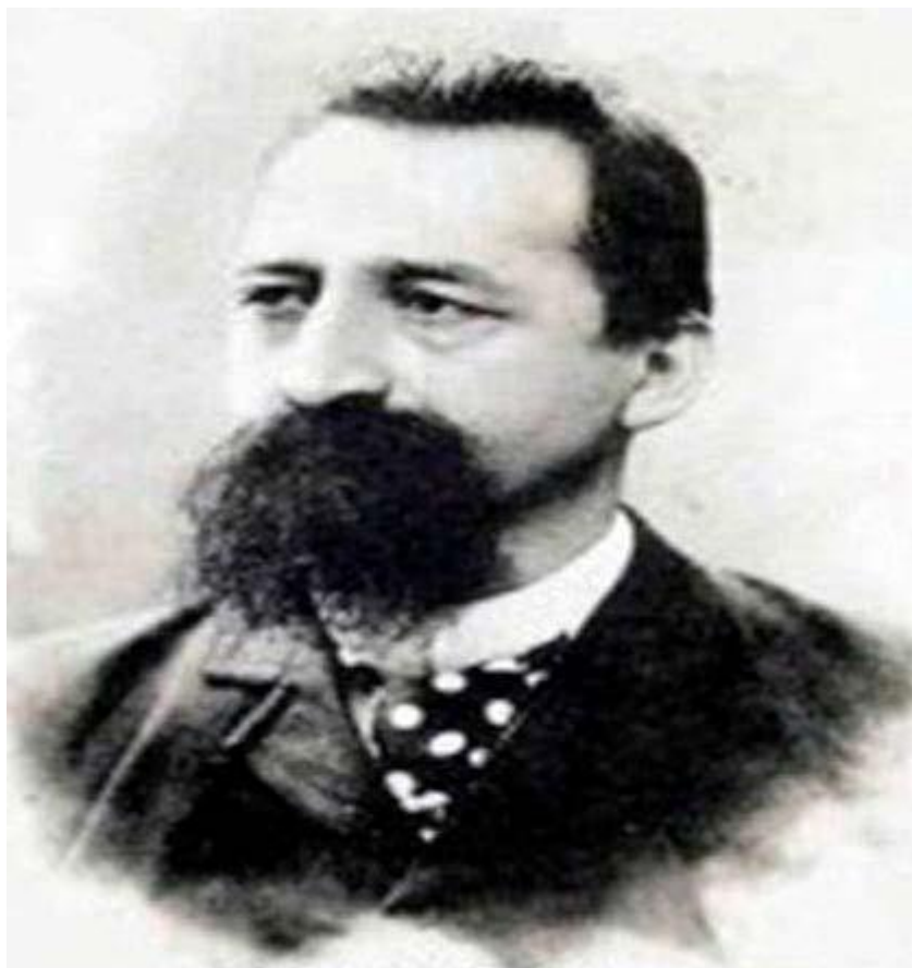
Fig. 3. Edoardo Porro (1842-1902).

El 21 de mayo de 1876, Porro realizó por primera vez la operación que más tarde llevó su nombre y que consistía en amputar supravaginalmente el útero después de la cesárea (primera cesárea seguida de histerectomía con éxito para la madre y el niño). La técnica fue publicada en Milán en el propio año 1876 con el título "De la amputación útero-ovárica como complemento de la operación cesárea" que produjo gran sensación entre los médicos. 22