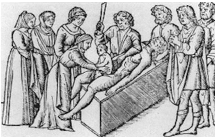
Fig. 1. Cesárea post mortem .

Otro posible origen de su nombre derivaba de la llamada "Ley Regia o Ley César" de Numa Pompilio , soberano de Roma entre los años 715 y 773 a.n.e.; ley que bajo los Césares habría tenido el apelativo de cesárea , y que imponía la extracción abdominal post-mortem para salvar al feto. 5,6 (Fig. 1).