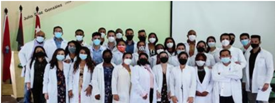
Fig. 2 - Estudiantes de postgrados que participaron en la XXVIII Jornada Científica de Residentes en Medicina Física y Rehabilitación.