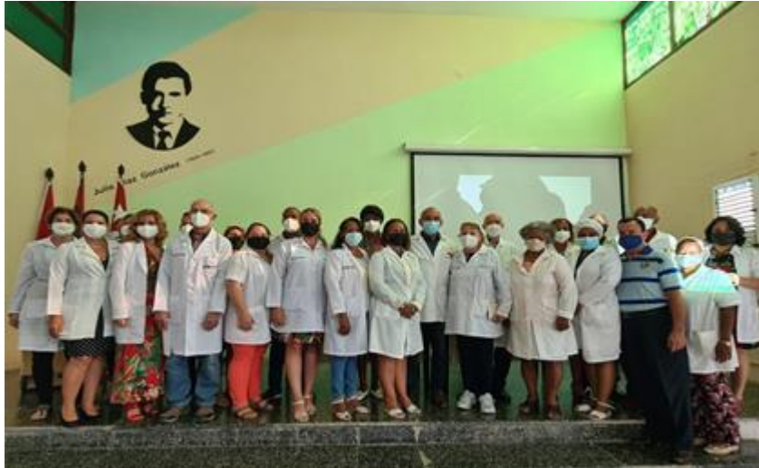
Fig. 1 - Profesores que participaron en la XXVIII Jornada Científica de Residentes en Medicina Física y Rehabilitación. Hospital de Rehabilitación “Julio Díaz González”.

Se contó además con la participación de 34 profesores en calidad de tribunal, tutores y comité organizador (fig. 1). En las sesiones científicas propias de esta jornada participaron un total de 40 ponentes entre nacionales y extranjeros en las categorías de residentes, internos verticales y diplomantes de la especialidad organizados en 8 tribunales (fig. 2).