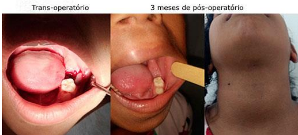
Fig. 3 - Trans-operatório intraoral e pós operatório intra e extra oral.

Foi feito o acompanhamento após 3 meses da cirurgia, sem sinais de recidiva (Fig. 3). Paciente foi encaminhada para adequação do meio bucal e continua em proervação do caso, já tendo apresentado melhora na higienização (índice de placa em 15,9 % após os 3 meses).