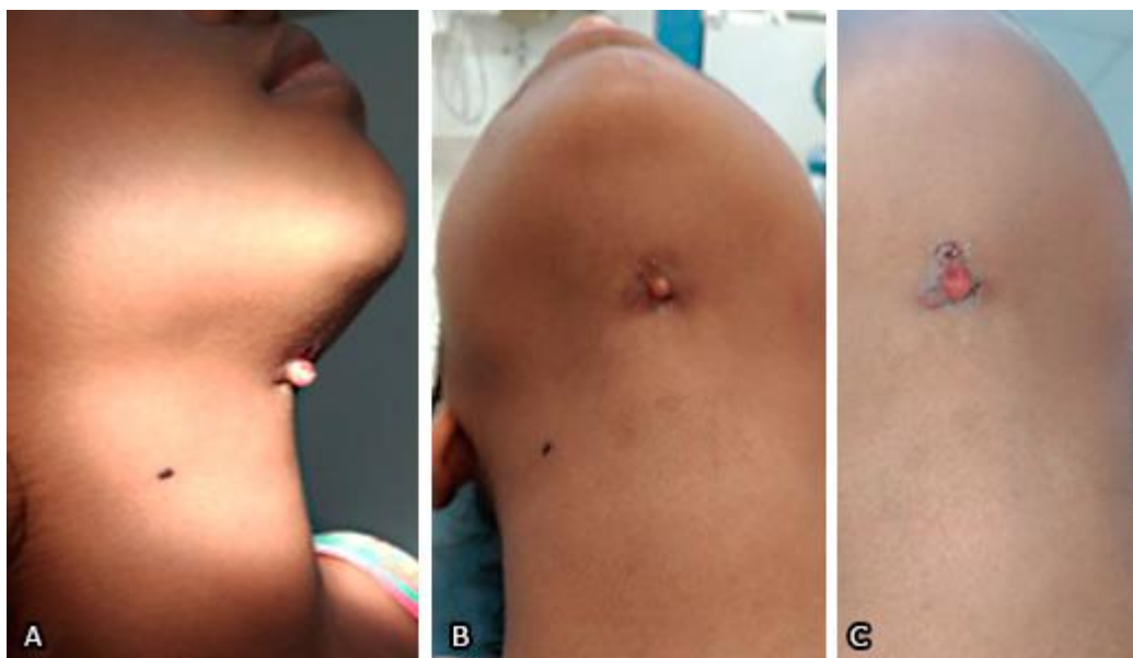
Fig. 1 - Condição extra-oral da paciente, evidenciando ponto de drenagem extra-oral cutâneo; vista lateral (A) e inferior (B-C).

Realizou-se o exame físico intrabucal e pôde-se ratificar o péssimo estado de conservação da saúde bucal (índice de placa visível encontrava-se em 40%), como descrito no relatório de alta hospitalar chamando atenção os dentes 36 e 46 com extensa destruição coronária, comprometimento do espaço biológico periodontal e a presença de restaurações provisórias que ratificavam a história da genitora quanto a tentativa de tratamentos conservadores (Fig. 2).