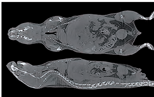
Figura 2. Imagen por microtomografía computarizada, vista coronal y sagital por reconstrucción de un examen sin contraste de cuerpo completo de ratón. Se observan todos los órganos y estructuras tanto internas como externas con atenuaciones diversas según su composición (unidades Hounsfield). (18).

Los datos obtenidos durante el examen son convertidos por un procesador en una serie de imágenes bidimensionales en sección transversal. Gracias a los procesadores, es posible realizar reconstrucciones en planos sagital y dorsal habilitando entonces una representación en 3D del objeto de interés. La tomografía computarizada es una técnica de alta resolución espacial, aunque esta resulta dependiente de la capacidad del equipo ( Figura 2 ) (15,18).