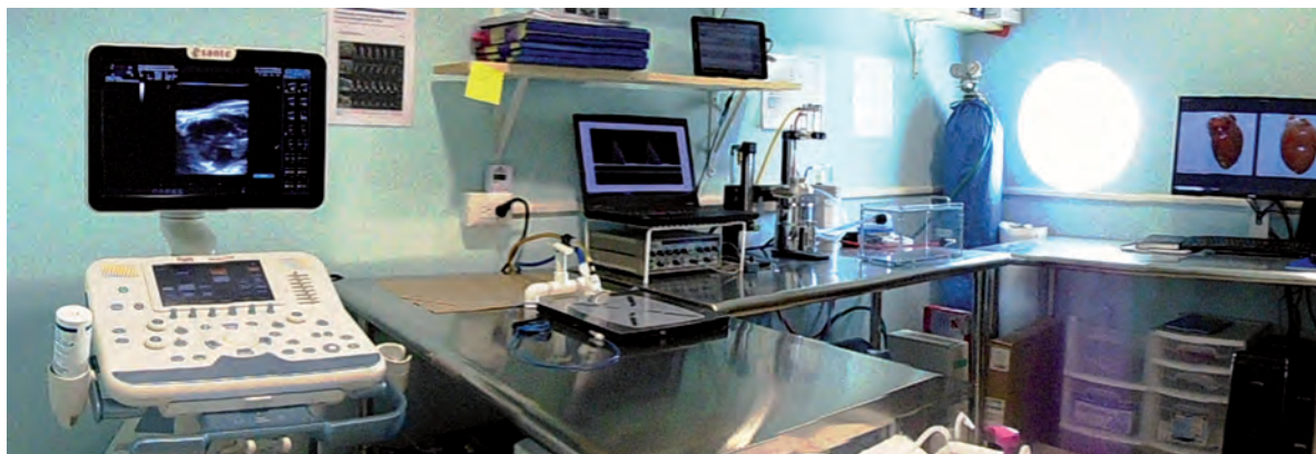
Figura 4. Área de Imagenología y Señales Biomédicas, Centro de Investigaciones Regionales Dr. Hideyo Noguchi de la Universidad Autónoma de Yucatán.

El trabajo realizado hasta el momento nos ha permitido implementar de manera sistemática la ecografía como herramienta en las investigaciones que se encuentran en curso en el Laboratorio de Parasitología, relacionadas con la infección por T. cruzi y su control (39,40). Actualmente, estamos desarrollando diversas investigaciones para caracterizar a profundidad la progresión del daño cardiaco como resultado de la infección por T. cruzi en el modelo murino y para identificar sus causas. Adicionalmente, se utiliza la ecografía para