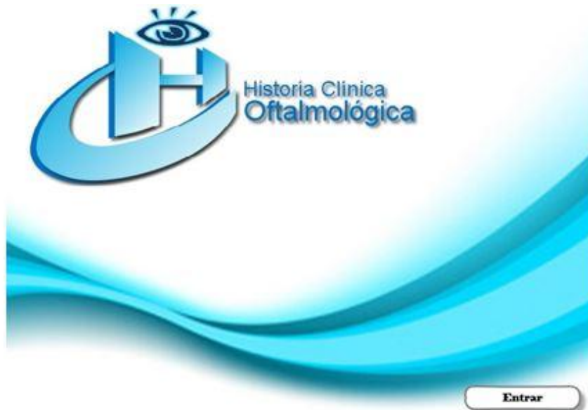
Fig. 1. Pantalla de inicio de la aplicación de la historia clínica electrónica en oftalmología

El sistema se diseñó de manera tal que permitiera el acceso al sistema de la HCE, a los datos del desarrollador y a la pantalla para autenticar usuario y que este se pueda registrar en el sistema.