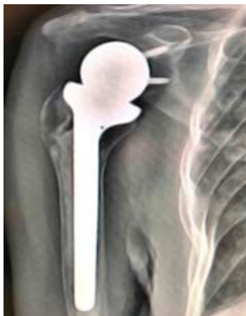
Figura 2: Artroplastia reversa de hombro en paciente con lesión irreparable del manguito rotador y pseudoparálisis.