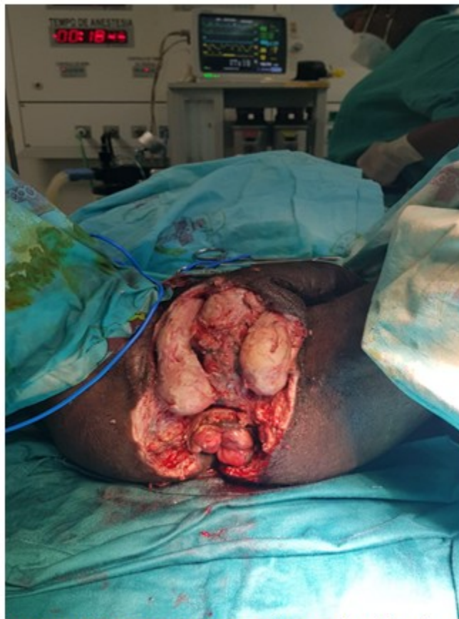
Fig. 3. Paciente con gangrena de Fournier (el mismo de la figura 2) después de su tercera visita al salón de operaciones, prácticamente sin esfacelos ni focos de necrosis.

Se sugiere una media de 3,5 operaciones por paciente para un adecuado control de la infección. (9) Los tejidos son cultivados de modo rutinario y se obtienen biopsias que aseguran la resolución de la infección para la ulterior reconstrucción e injerto, práctica que mejora los resultados en los cuidados. (15)