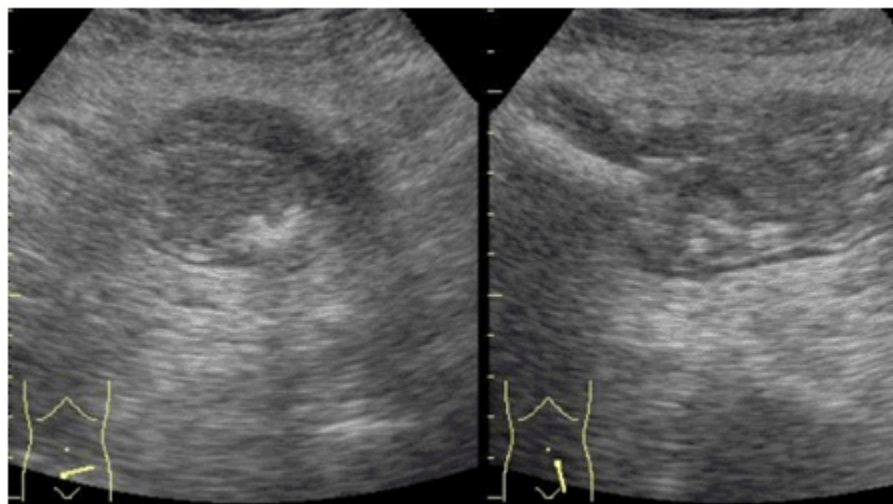
Figuras 1 y 2. Perspectiva de la ultrasonografía que muestra imagen de falso riñón.

Radiografía de colon por enema: Defecto de lleno a nivel de la unión recto-sigmoidea, que se