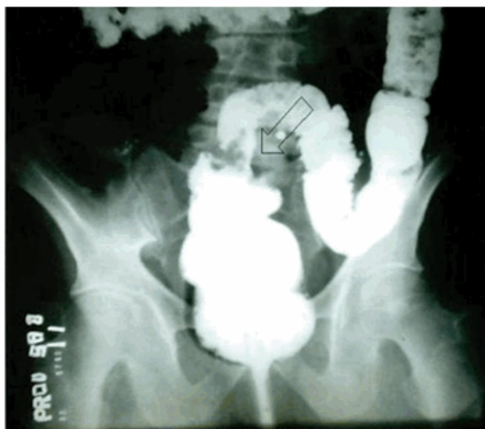
Figura 3. Radiografía de colon por enema (vista AP). Se observa imagen por sustracción a nivel de la unión recto-sigmoidea en relación con neoplasia.

mantiene desde todas las vistas, lo cual se relaciona con neoplasia a ese nivel. (Figura 3)