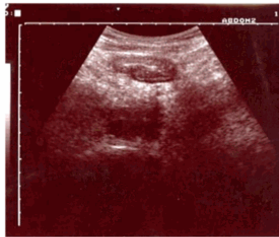
Figura 7. Perspectiva de la ultrasonografía

Radiografía de colon por enema: Se observó defecto de lleno a nivel del colon ascendente,