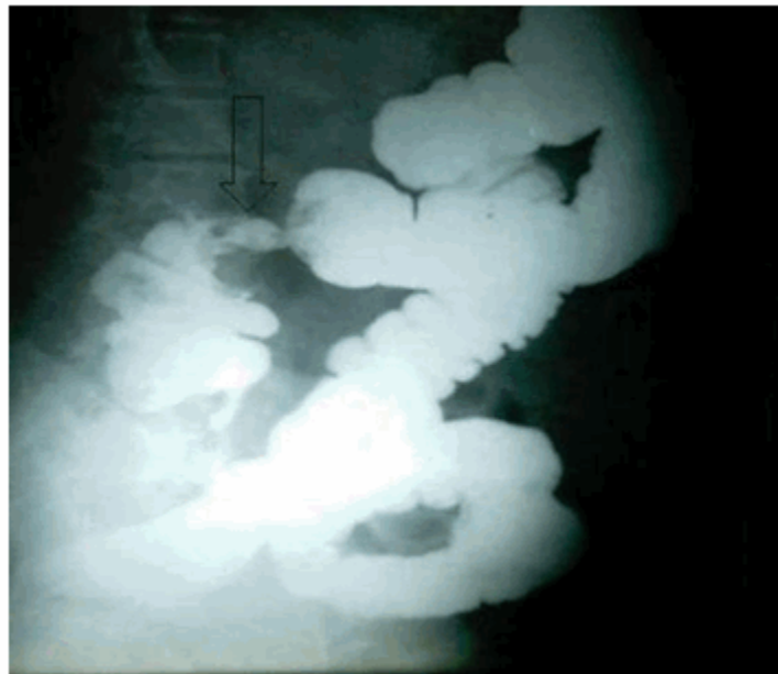
Figura 8. Rayos X de colon por enema donde se observa imagen por defecto de lleno en relación con cáncer de colon ascendente.

que se mantuvo en todas las vistas, lo cual está en relación con neoplasia a ese nivel. (Figura 8)