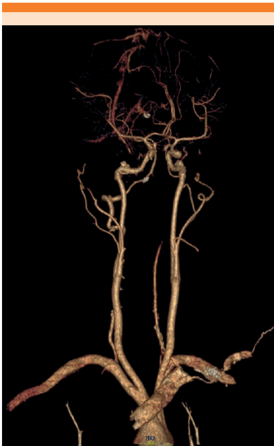
Figura 1. Angiotomografía computada de troncos supraaórticos y polígono de Willis que muestra pérdida de la densidad de flujo de la arteria vertebral izquierda desde la parte distal del segmento V2 hasta V4 con recanalización del segmento más distal, probablemente por efecto hemodinámico. Flujo en la arteria vertebral derecha.

en los segmentos V3 y V4 izquierdos, hallazgos compatibles con disección de la arteria vertebral izquierda en los segmentos mencionados.