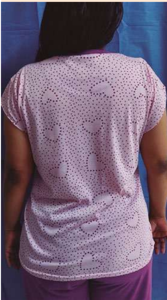
Figura 1. Hiperpigmentación de la piel.