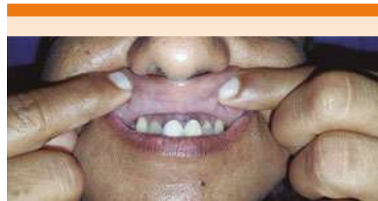
Figura 2. Hiperpigmentación de las encías.