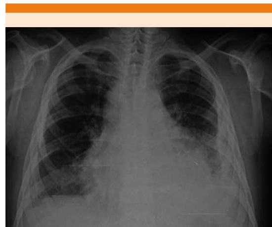
Figura 1. Radiografía de tórax anteroposterior. Se observa ensanchamiento del mediastino y silueta cardíaca en imagen de copa invertida, sugerente de derrame pericárdico masivo.

Se consultó al servicio de Cardiología, donde se hizo procedimiento ecocardiográfico que diagnosticó derrame pericárdico severo ( Figura 3 ). El colectivo médico decidió realizar pericardiocen-