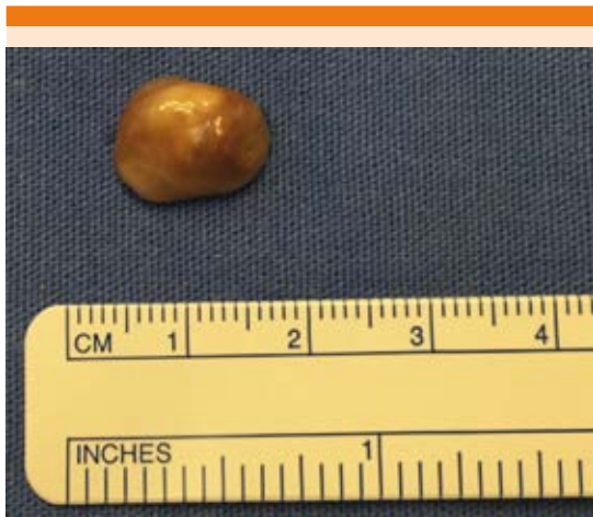
Figura 3. Imagen del cisticerco extraído.

cerdo para la forma de larva. El parásito adulto tiene una cabeza (escólex) con cuatro ventosas que se adhieren a la pared intestinal y desprende proglótidos, liberando huevos resistentes al ambiente. En lugares con higiene deficiente y mal manejo de desechos humanos, los cerdos tienen contacto e ingestión accidental de los huevos de T. solium , una vez en el intestino del cerdo los huevos liberan oncosferas, que cruzan la pared intestinal y entran al torrente sanguíneo para ser llevados a diferentes tejidos donde evolucionan a cisticercos, lo que vuelve al cerdo huésped intermediario. El ciclo se completa cuando el humano consume carne de cerdo contaminada y en el intestino delgado el cisticerco se libera por la acción de enzimas digestivas, se evagina y se adhiere a la pared intestinal, donde los proglótidos comienzan a multiplicarse alcanzando una forma madura cuatro meses después de la infección. 1-7