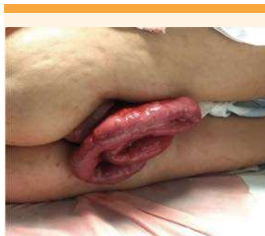
Figura 1. A su ingreso al servicio de urgencias.

Dos días posteriores al procedimiento quirúrgico se le tomó una biopsia cervicovaginal, en búsqueda de enfermedad maligna: solo se reportó un proceso inflamatorio agudo crónico, inespecífico, sin evidencia de malignidad.