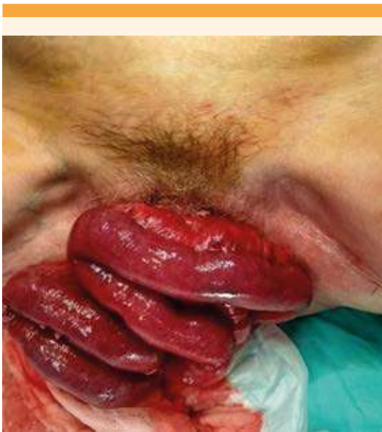
Figura 2. Imagen preoperatoria.