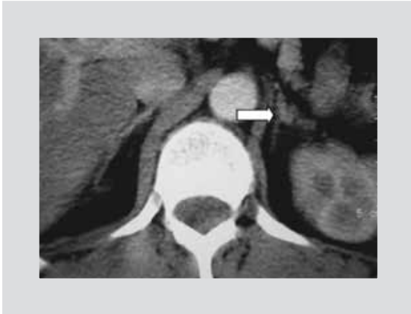
Figura 1. CT de suprarrenales. Se observa una probable tumoración en la glándula suprarrenal izquierda (flecha blanca).

A continuación, se presentan dos casos de HAP con presentación clínica poco habitual, en los que se detectó hiperplasia unilateral.