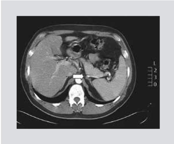
Figura 3. CT de suprarrenales del caso clínico 2. Se observa una probable tumoración en la glándula suprarrenal izquierda (flecha blanca).

Una vez realizadas las pruebas de escrutinio y en casos de alta sospecha de HAP (la relación PAC/PRA es negativa, pero el paciente tiene datos clínicos y bioquímicos altamente sugestivos de HAP), se procede a realizar las pruebas confirmatorias. La más sensible de ellas es la infusión de 2 l de solución salina al 0.9% durante 4 h con el paciente recostado por lo menos 1 h antes y durante el estudio, con la monitorización de la frecuencia cardíaca y de la presión arterial. En este estudio, una PAC > 10 ng/dl es altamente sugestiva del diagnóstico. Otras pruebas validadas y confirmatorias son la carga oral de sodio, la prueba de fludrocortisona y la prueba de captopril 7,11 .