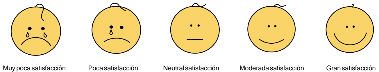
Figura 1. Escala de Satisfacción, * Modificado de 17

Para evaluar la tolerancia a la fórmula se analizó la presencia o ausencia de vómito, regurgitación en frecuencia e intensidad, distensión abdominal, y características y número de evacuaciones, lo anterior evaluado por el neonatólogo adscrito al servicio, el cual tampoco conocía el cambio de la fórmula. Se determinó además la ganancia ponderal día a día, en donde las mediciones fueron tomadas por nutriólogos estandarizados. Un incremento ponderal con número de evacuaciones sin cambio o sin incremento significativo fue interpretado como tolerancia satisfactoria a la fórmula. Los pacientes fueron observados durante cuatro días en promedio.