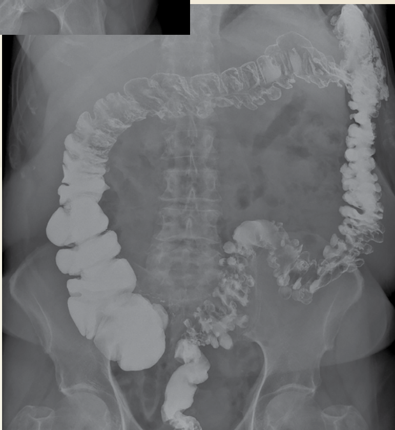
Figura 2. Colon por enema; proyección anteroposterior de abdomen en decúbito postevacuación

5. ¿Cuál es la complicación más común de esta alteración?