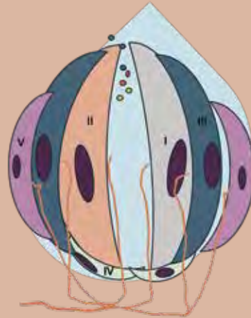
Figura 2. Esquema de un botón gustativo

Se identifican las células del tipo I al V. El tipo I detectan sabor salado; las II, dulce, amargo y umami; las III, salado; las células IV son células basales; y las V, células de soporte marginales.