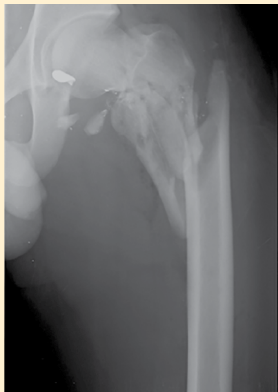
Figura 1. Fractura subtrocantérica de cadera izquierda (se observa artefacto a nivel de cabeza femoral).

Paciente del sexo masculino, 16 años, quien el día 11 de abril del 2015, a las 4:00 am, acudió al servicio de urgencias con diagnóstico de herida por arma de fuego en extremidad izquierda. Refirió haber sido atacado por terceras personas, las cuales detonaron un arma de fuego, recibió un impacto de bala a nivel de cadera izquierda, por lo que fue llevado al servicio de urgencias.