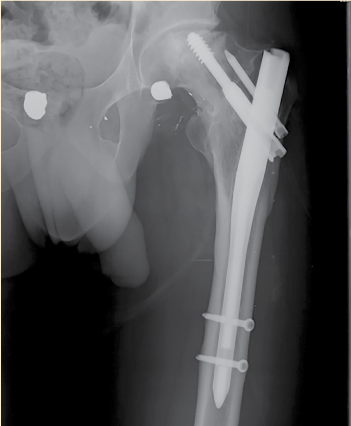
Figura 3. Aplanamiento de la cabeza femoral, sugestivo de necrosis avascular, más clavo centromedular PF Aesculap con datos de aflojamiento de tornillo anti rotacional.