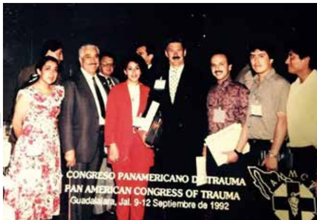
Figura 7: Congreso Panamericano de Trauma, México 1992.

La trayectoria del Dr. Vicencio fue reconocida por múltiples asociaciones internacionales en las que militó como el Colegio Americano de Cirujanos (FACS) desde 1970; el Colegio Internacional de Cirujanos (FICS) desde 1976; el Colegio Internacional de Cirugía Digestiva, con sede en Roma, desde 1972; la Sociedad Panamericana de Trauma,