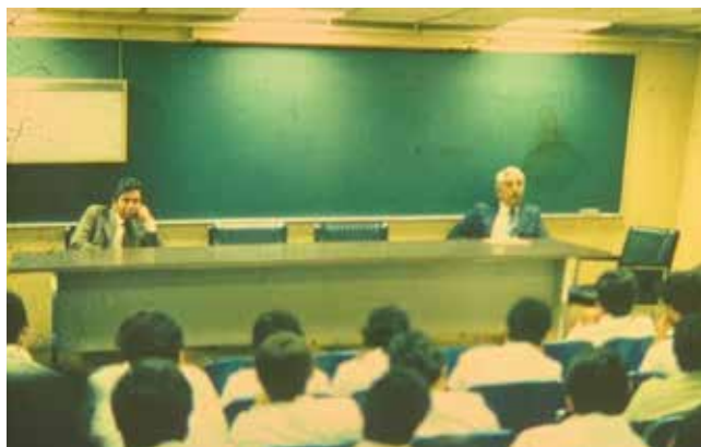
Figura 6: Sesión académica del Curso de Posgrado en Cirugía General, Hospital General «Dr. Rubén Leñero».

la titularidad del mismo en 1999. Pero éstos no fueron sus primeros pasos en la docencia de la práctica médica y quirúrgica, ya que se desempeñó como profesor de enfermería quirúrgica en la Escuela de Enfermería de la Cruz Roja, fue profesor de anatomía descriptiva y disecciones anatómicas en la Escuela de Medicina de la Universidad Autónoma de Guanajuato, profesor de introducción a la cirugía y clínica de gastroenterología por parte de la Universidad Nacional Autónoma de México (Figura 6).