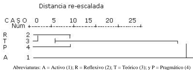
Fig. 3 - Resultados del análisis de conglomerados.