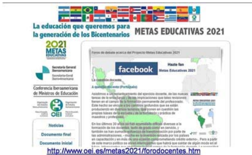
Fig. 3. Organización de estados iberoamericanos.

- El valor de los valores. Brinda un espacio para mostrar numerosos recursos sobre la formación en valores en las organizaciones, permitiendo la preparación autodidacta a través de la adquisición de artículos, libros y otros recursos digitales para el desarrollo de esta actividad en las organizaciones (Fig. 4).