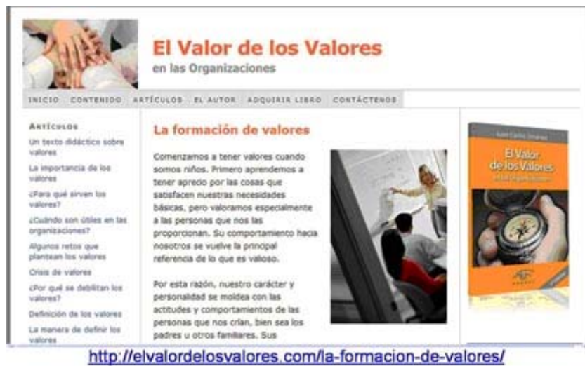
Fig. 4. El valor de los valores en las organizaciones.