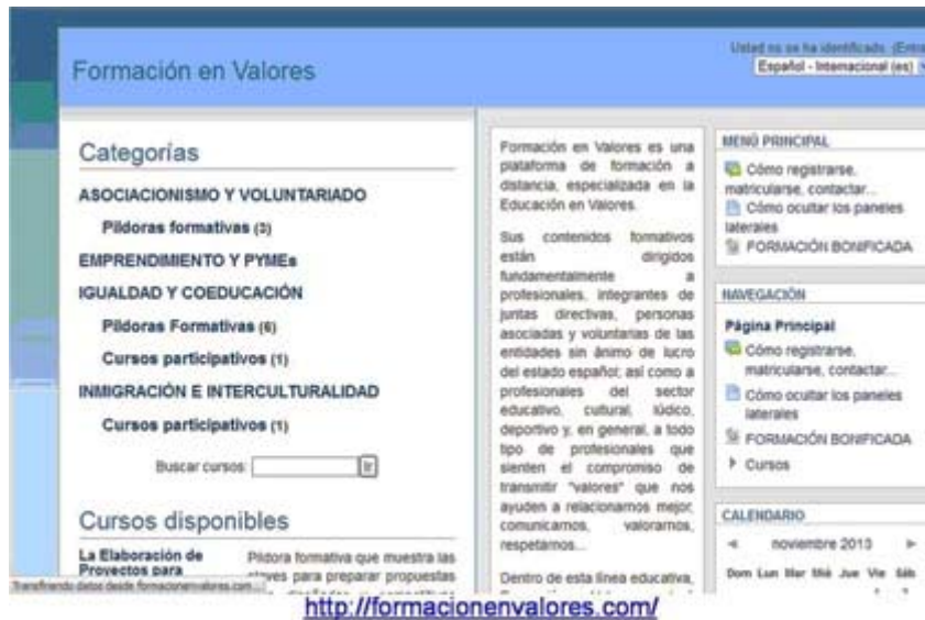
Fig. 2. Formación en valores.