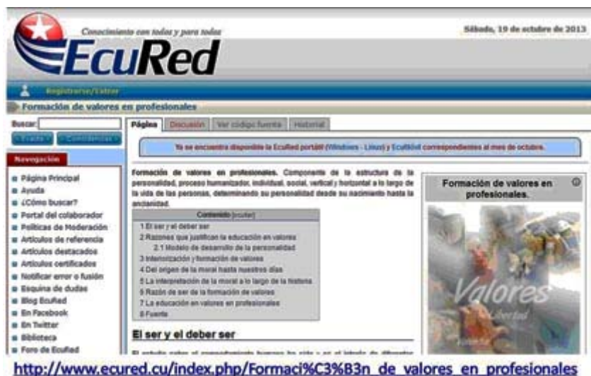
Fig. 5. EcuRed.