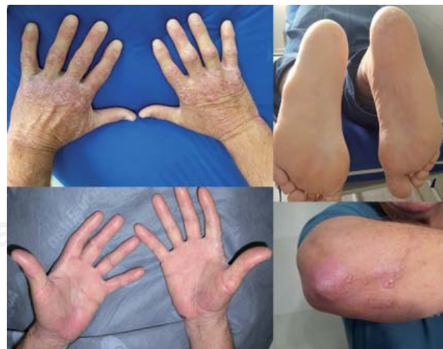
Figura 4. Involución de lesiones al tratamiento con colchicina.