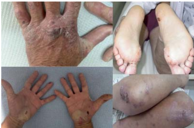
Figura 1. Ampollas con contenido serohemático que alternan con erosiones, placas eritematoescamosas y cicatrices con quistes de millium, localizadas en manos, pies, codos.

El paciente había recibido tratamiento con corticosteroides sistémicos, dapsona y metotrexato, sin respuesta, por lo que se indicó colchicina 1 mg/día, con buena tolerancia y mejoría clínica a los seis meses de tratamiento ( Figura 4 ).