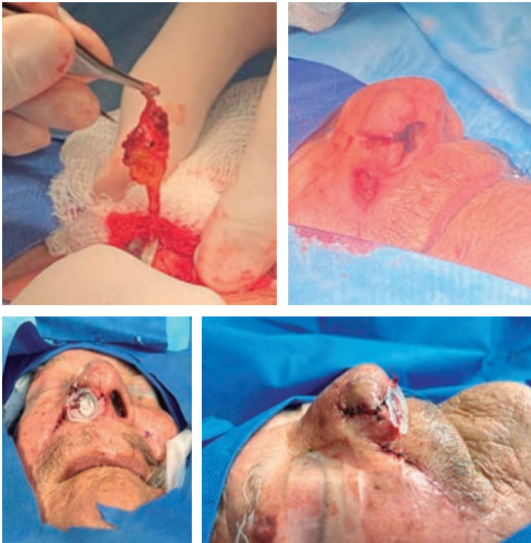
Figura 4: Independización del colgajo nasogeniano con colocación de conformador.

llo más usados por su aplicabilidad en múltiples situaciones y defectos. Se ha descrito su utilización exitosa para cubrir defectos cutáneos del ala nasal, tanto vestibulares como externos, en