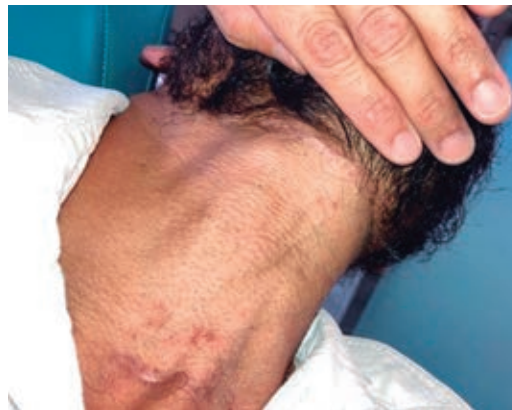
Figura 7: Resultado funcional y estético de cuello en el periodo de seguimiento postoperatorio a dos meses.

Al tomar como referencia la literatura más reciente sobre el reporte de tasas de éxito y complicaciones entre poblaciones sometidas tanto a reconstrucción con colgajos libres como pediculados, los resultados mostrados son comparables. En un estudio publicado en 2023 por Sittitrai y colaboradores, se evaluaron 171 pacientes diagnosticados con carcinoma de cavidad oral y fueron tratados con cirugía reconstructiva posterior a ablación. Se dividieron en dos grupos: los que se sometieron a cirugía de colgajo pediculado y los que se les realizó el colgajo libre. Se consideró a pacientes sometidos a cirugía radical, resección amplia de cuello