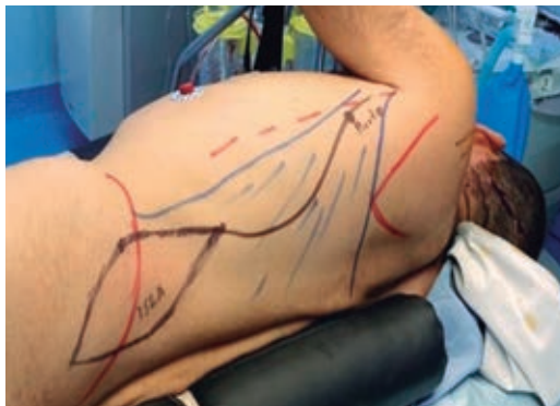
Figura 2: Marcaje de músculo dorsal ancho para obtención de colgajo miofasciocutáneo.