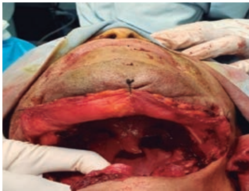
Figura 3: Transquirúrgico. Se realizó tunelización desde cuello a piso de la cavidad oral para colocar el colgajo.

transquirúrgico y en el periodo de recuperación postoperatorio. Después de la resección ( Figura 1 ), se realizó reconstrucción de piso de boca mediante colgajo miofasciocutáneo pediculado de dorsal ancho, optando por dicha opción por no contar con microcirujano, estado socioeconómico del paciente para trasladarse a otra ciudad con microcirujano y morbilidad en vasos receptores tras radioterapia. El diseño del colgajo incluyó isla cutánea en la porción más distal del músculo ( Figura 2 ), el uso del borde lateral del mismo y su paso subclavicular, logrando con esto oclusión del piso de la boca ( Figuras 3 a 5 ). No hubo complicaciones transoperatorias. Permaneció hospitalizado cuatro días y fue egresado con adecuada tolerancia oral.