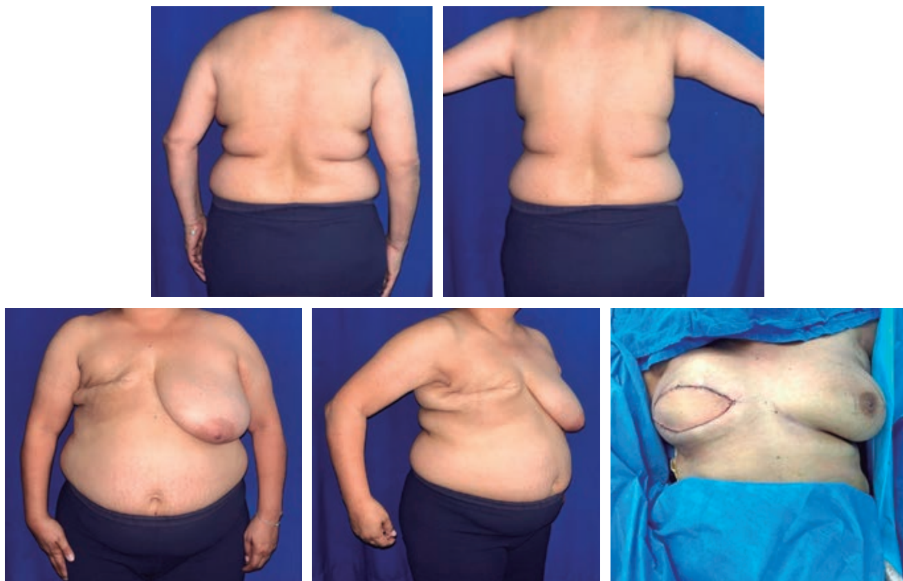
Figura 3: Reconstrucción con colgajo musculocutáneo de dorsal ancho.