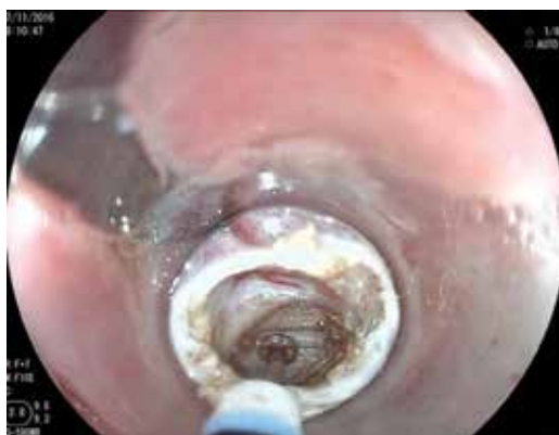
Figura 3: Inicio del corte con el capuchón plástico y posteriormente se observan fibras musculares del cricofaríngeo.