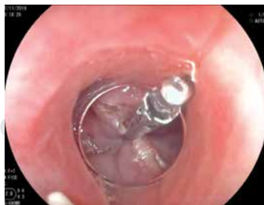
Figura 5: Cierre de la incisión de la mucosa con clips metálicos.

El seguimiento se realizó de forma telefónica y por consulta externa al mes del proce-