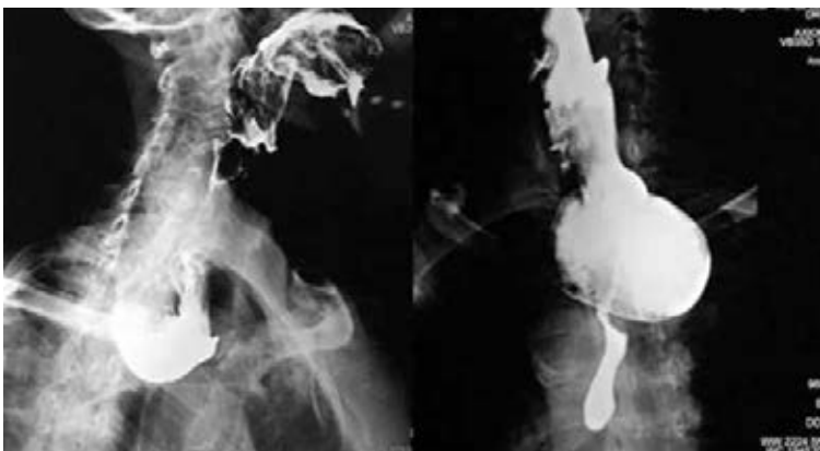
Figura 1: Imagen radiológica de divertículo de Zenker.

Criterios de inclusión: expedientes clínicos de pacientes con las siguientes características: ser derechohabiente del ISSSTE, expediente completo de acuerdo con la NOM-004-SSA3-2012, sin distingo de edad o sexo, con divertículo de Zenker confirmado mediante radiología y endoscopia, con seguimiento de por lo menos seis meses posterior al procedimiento.