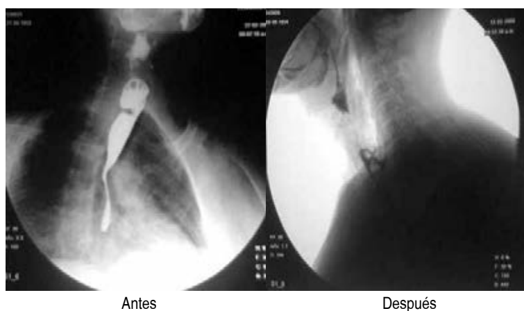
Figura 7: Control radiológico sin evidencia de divertículo.

De los 14 pacientes sometidos a procedimiento endoscópico, cuatro (28.5%) se reintervinieron, dos por recurrencia de sintomatología leve a los tres y cuatro meses respectivamente, uno por sangrado moderado que limitaba la visualización adecuada en el procedimiento inicial, el cual se repitió a las 24 horas, y otro que fue sometido a tratamiento en dos sesiones por las dimensiones del divertículo, el cual fue referido en reporte radiológico de 6 x 7 cm, por lo que se decidió efectuar el procedimiento endoscópico en dos tiempos (Tabla 2).