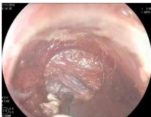
Figura 4: Corte completo en las fibras del cricofaríngeo.

car el septum del músculo cricofaríngeo. En los primeros 10 casos se utilizó un videogastroscopio Olympus modelo GIF-H140 y procesador de imagen CV-140 Olympus (Olympus Optical Co., Tokio, Japón) de 9.8 mm de diámetro, la unidad electroquirúrgica Olympus UES-40 SurgMaster, y como disector un cuchillo aguja (Needle Knife, Cook Endoscopy, Winston-Salem, NC), se hace un corte en el borde de la luz esofágica en la parte media del septum y hacia la luz del divertículo. Se realiza primero el corte de la mucosa exponiendo las fibras musculares del cricofaríngeo (Figura 3), el corte se profundiza hasta completar la sección de las fibras transversales del esfínter cricofaríngeo, sin necesariamente llegar al fondo del divertículo (Figura 4), lo que permite la aproximación de los bordes de la incisión en la mucosa con