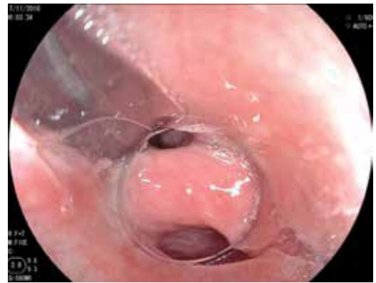
Figura 2: Introducción de guía metálica a esófago como primer paso y posterior colocación de dilatador de Savary Gilliard para delimitar septum diverticular.

Criterios de exclusión: expedientes clínicos incompletos, divertículo menor de 2 cm, tratamiento quirúrgico previo o endoscópico no exitoso.