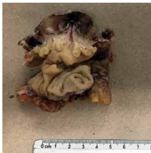
Figura 2: Pieza quirúrgica (ciego después del tratamiento con formol), con sección sagital donde se observa el trayecto del divertículo desde el lumen intestinal hasta la grasa peridiverticular.

(fóliculos linfoides con centros germinales con macrófagos en su interior, la submucosa con tejido conjuntivo laxo vascularizado).