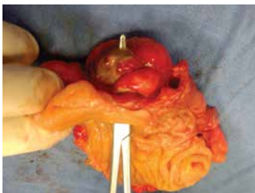
Figura 1: Ciego abierto que muestra el sitio de entrada del divertículo y el sitio de perforación en el segmento antimesentérico (punta de la pinza), así como la inflamación de la grasa peridiverticular.

El reporte de patología confirmó el diagnóstico de divertículo de 1 \times 0.5 cm con infiltrado inflamatorio linfoplasmocitario y leucocitos polimorfonucleares, macrófagos y fibrina (diverticulitis) (Figuras 2 y 3). El reporte del apéndice no mostró evidencia de patología