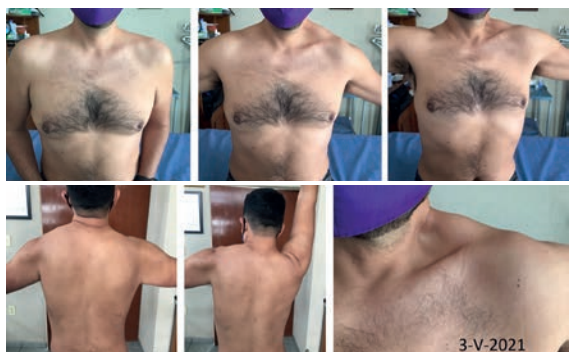
Figura 1. Fotografías clínicas a 24 horas de la lesión del nervio espinal izquierdo

Masculino de 38 años, profesionista, acude 24 horas posteriores (3-V-2021) a haber sufrido asalto, siendo sometido con “llave china” hasta perder estado de alerta, presentando imposibilidad para efectuar abducción completa de hombro izquierdo. En la exploración dirigida: al momento de intentar efectuar abducción se observa, hueco supraclavicular, el tono del esternocleidomastoideo izquierdo y del trapecio izquierdo muy disminuido, imposibilidad para la realización de abducción completa de hombro izquierdo, llegando únicamente a 60 grados; la escápula izquierda alada, con desplazamiento hacia afuera (figura 1). Resto de exploración normal.