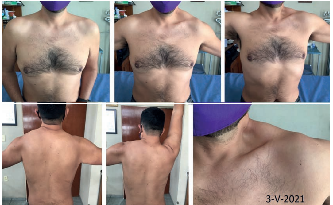
Figura 1. Fotografías clínicas a 24 horas de la lesión del nervio espinal izquierdo

Masculino de 38 años, profesionista, acude 24 horas posteriores (3-V-2021) a haber sufrido asalto, siendo sometido con “llave china” hasta perder estado de alerta, presentando imposibilidad para efectuar abducción completa de hombro izquierdo. En la exploración dirigida: al momento de intentar efectuar abducción se observa, hueco supraclavicular, el tono del esternocleidomastoideo izquierdo y del trapecio izquierdo muy disminuido, imposibilidad para la realización de abducción completa de hombro izquierdo, llegando únicamente a 60 grados; la escápula izquierda alada, con desplazamiento hacia afuera (figura 1). Resto de exploración normal.