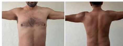
Figura 3. Fotografías clínicas mostrando abducción a 90° de ambos hombros

Se efectúa diagnóstico de lesión del nervio espinal izquierdo. A tres semanas de la lesión, la electromiografía mostró presencia de fibrilaciones y ondas positivas. Se le manejó con gabapentina a dosis de 300 mg dos veces al día, Dexametasona a dosis inicial de 60 mgs/ con disminución paulatina durante 10 días y, tiamina a dosis de 300 mg dos veces al día, más programa de rehabilitación con aplicación de ultrasonido terapéutico a dosis de 1 W/cm 2 en zonas izquierdas II y III de cuello, así como electroestimulaciones con corriente galvánica inicialmente, pasando a corriente farádica a los 30 días. 5 meses después, evolución satisfactoria, con examen clínico muscular en 4+/5. (Figuras 2 y 3), confirmando neuropraxia del XI par craneal.