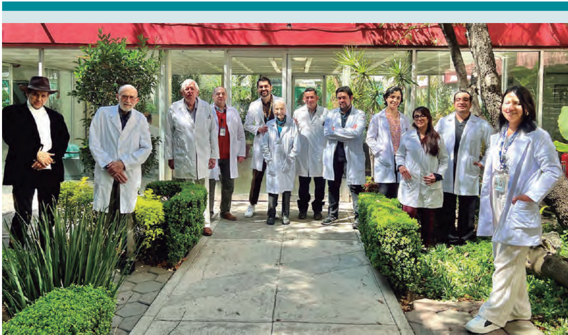
Figura 6. El grupo de Patología. 2023.

notaba la parte endeble de un planteamiento, la falsedad en una argumentación y la intención solapada en una propuesta. Y defendía sus posiciones científicas, políticas y sociales sin alterarse ni levantar la voz; su voz que además era muy clara y agradable de escuchar.