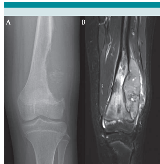
Figura 2. Paciente de 12 años con 3 meses de evolución con dolor en rodilla izquierda, con aumento de volumen, dolor en la cara lateral de fémur distal, sin otros hallazgos. La radiografía en proyección anteroposterior ( A ) demostró una lesión destructiva (osteolítica) en el fémur distal, con márgenes mal delimitados, reacción perióstica y masa de partes blandas. Ante estos hallazgos, está indicado realizar una RMN del fémur izquierdo con uso de gadolinio, confirmando la presencia de una neoplasia agresiva con extensión de la lesión al tejido blando ( B ). Estos hallazgos son consistentes con un osteosarcoma, confirmado en el estudio anatomopatológico por biopsia con aguja.

La RMN es el principal método de estudio para la sospecha de tumores agresivos o malignos del hueso o partes blandas. 18 La ventaja es que permite un contraste de tejidos superior a otras técnicas de imágenes, lo que permite distinguir el compromiso óseo medular, o diferenciar un tumor de partes blandas adyacentes no comprometidas ( Figura 2B ). 19 El estudio en muchas ocasiones puede requerir el uso de gadolinio