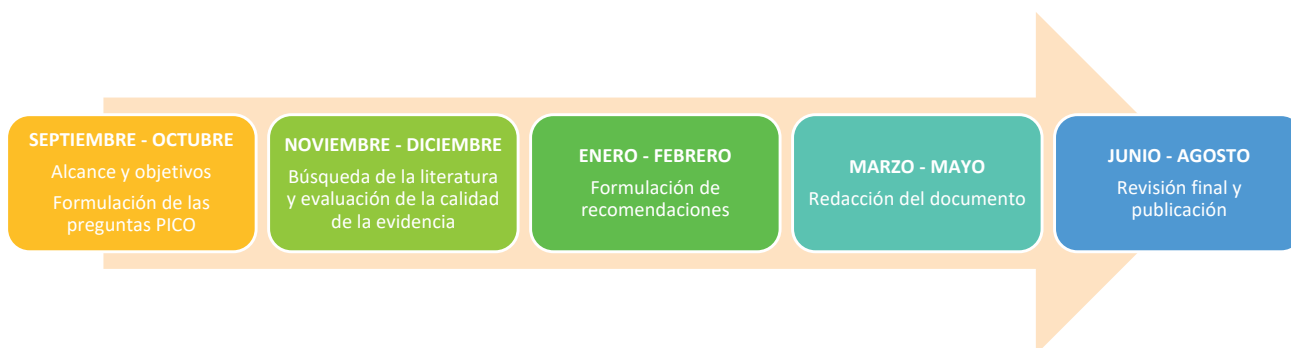
Figura 1. Metodología de elaboración de la guía. Elaboración propia.

La guía fue elaborada de septiembre de 2023 a agosto de 2024. (Figura 1)