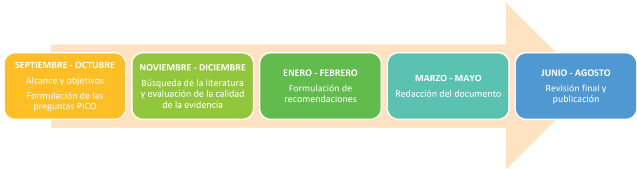
Figura 1. Metodología de elaboración de la guía. Elaboración propia.

La guía fue elaborada de septiembre de 2023 a agosto de 2024. ( Figura 1 )