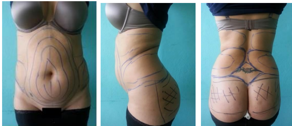
Fig. 1 - Preoperatorio.