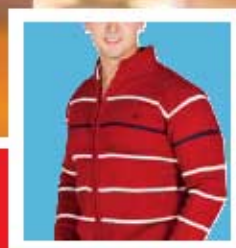
ROPA Y CALZADO

¡TODO en un mismo lugar! Y tus pagos serán DESCONTADOS VÍA NÓMINA