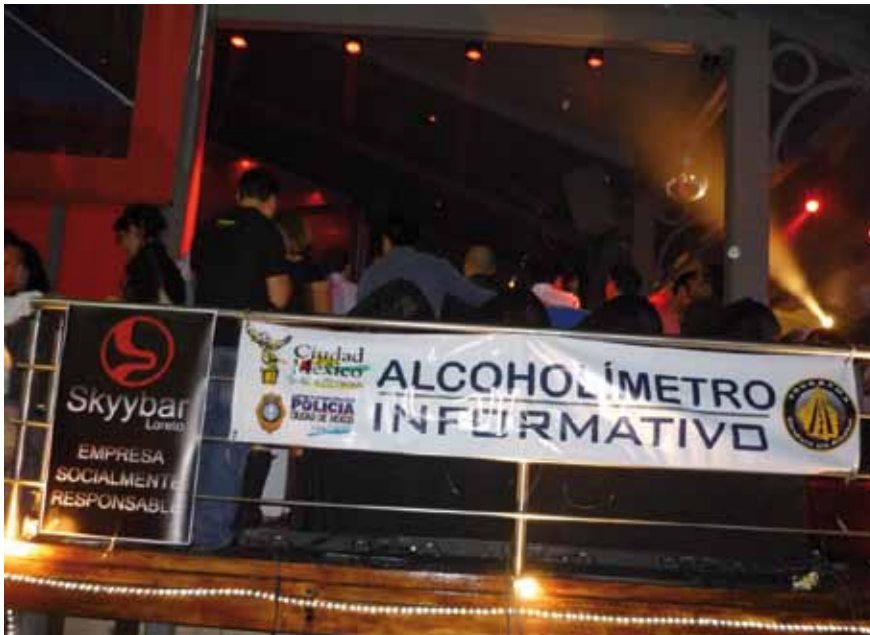
Punto informativo, instalado en Bar.