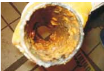
Facultad de Economía (5 lps).