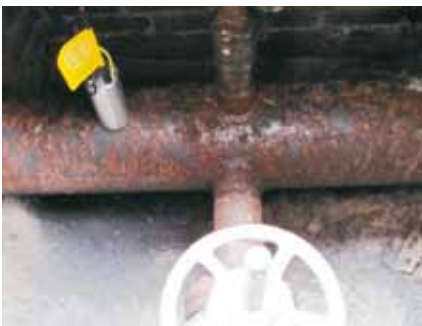
Detección con correlador.