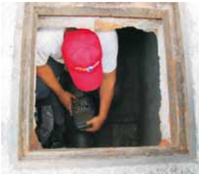
Utilización de medidor ultrasónico portátil en detección de fugas.