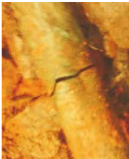
Tienda UNAM (2.8 lps).