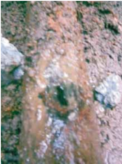
Facultad de Odontología «la muela» (2 lps).