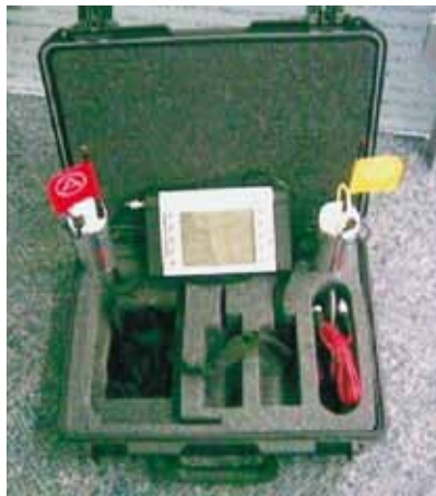
Correlador AQ610 Gutermann.