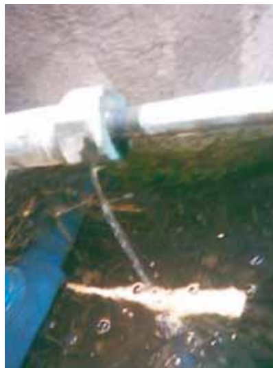
Facultad de Veterinaria (0.3 lps).