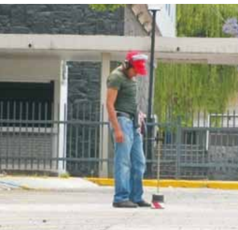
Detección de fugas con geófono.

Se instalarán válvulas reguladoras de presión para reducir la aparición de fugas y controlar las existentes.