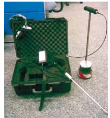
Geófono AS3 Gutermann.