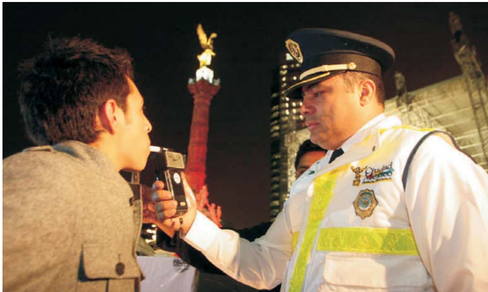
Figura 1. Personal del Programa Conduce Sin Alcohol de la Secretaría de Seguridad Pública del DF.

E n el 2002, el índice de accidentes de vehículos automotores en la Ciudad de México, producidos por conductores que irresponsablemente conducían sus vehículos bajo el influjo de bebidas alcohólicas, se vio incrementado de manera exponencial, de tal forma que las autoridades de la Secretaría de Seguridad Pública del Gobierno del D.F. se vieron en la necesidad de implementar medidas emergentes que tuvieran como fin prevenir el número de muertes que venían afectando primordial-