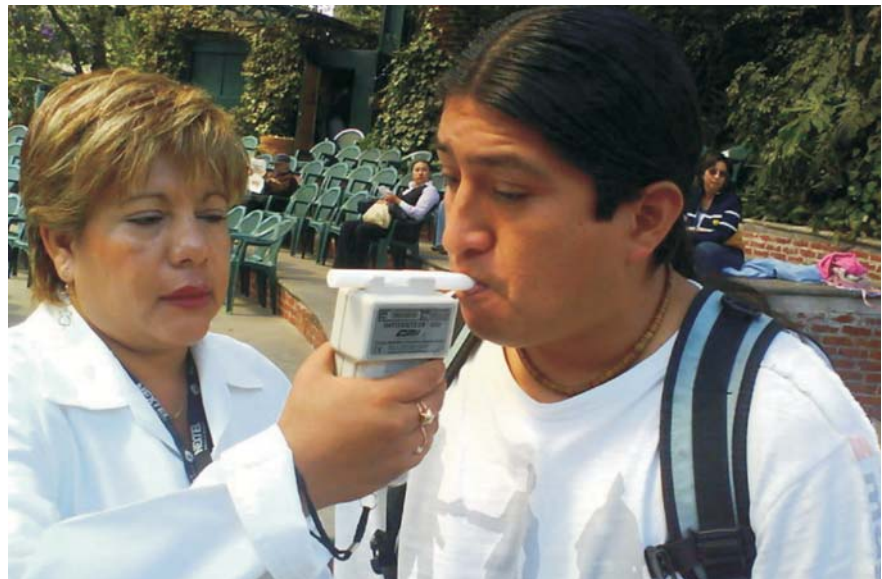
Figura 2. Equipo del Programa Conduce Sin Alcohol.

Subsecretaría de Participación Ciudadana y Prevención del Delito